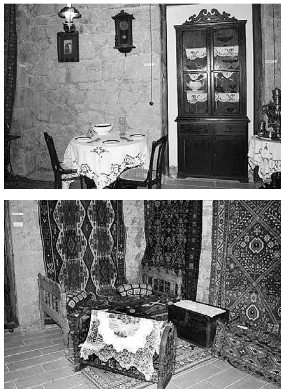
Рис. 3. Фрагменты временной экспозиции «Городская культура Дилижана в конце XIX – начале XX вв.».

жан. Еще в 2004 г. была приостановлена выставочная деятельность филиала «Службы по охране исторической среды и историко-культурных музеев-заповедников» – Музея народной архитектуры г. Дилижана, так как территория и строения, где размещался музей, были сданы в аренду частному лицу. В домах были организованы меблированные в традиционном стиле отель, ресторан, магазины. Здесь же некоторое время экспонировалась часть музейной коллекции. С 2011 года коллекция вышеназванного музея полностью оказалась в фондах. Сотрудниками «Службы» был разработан проект, согласно которому предлагалось арендовать под выставочный зал на первом этаже частной гостиницы.