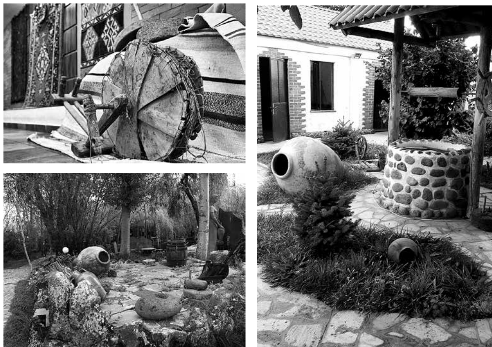
Рис. 1. Фрагменты оформления ресторанных и гостиничных комплексов.

используется не только в традиционных формах музейной деятельности, но и в телевизионных передачах 13 , на передвижных, коммерческих выставках типа Вернисажа в Ереване, при оформлении интерьера ресторанов, кафе, гостиниц и т. д. Предмет культуры превращается в орудие бизнеса, а «музейность» - в инструмент оформления интерьера и способ создания атмосферы. Казалось бы, что в этом плохого? Широкий ассортимент предметов-товаров с национальной окраской на Вернисаже, оформление интерьера ресторанов и гостиниц в национальном стиле привлекает внимание туристов, приносит неплохой доход. Однако, все это нередко делается непрофессионально, без учета истинной интерпретации, значимости предмета, часто идя на поводу у потребителя. Последствием этого является низкое, рассчитанное только на эффект и эмоции, качество предлагаемого продукта: проведение массового театрализованного мероприятия, «выставки» в ресторане, «экспонирование» этнографических артефактов в гостиницах и т. д. (рис. 1-1, 1-2, 1-3). Таковые не всегда удовлетворяют требо-