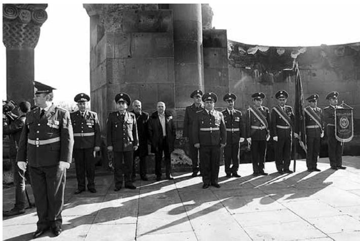
Рис. 2. Присяга новобранцев на территории «Историко-культурного музея-заповедника Звартноц».

ременные ритуалы. Начало положено: на территориях Мемориального комплекса Сардарapatской битвы, историко-культурного музея-заповедника Звартноц проводятся присяги новобранцев (рис. 2). Большой резонанс в обществе произвела попытка проведения свадьбы на территории историко-культурного музея-заповедника Звартноц. Неоднозначное отношение сложилось у общественности из-за упрощенного подхода к делу и антирекламы: просто была предоставлена территория для проведения свадебной церемонии без сопровождающих сценария и комментариев. Организованная специалистами традиционная церемония, исключая неоправданные нововведения, с разъяснениями, театрализованными представлениями, может этнически верно идентифицировать молодое поколение, послужить наглядным пособием для проведения традиционной свадьбы.